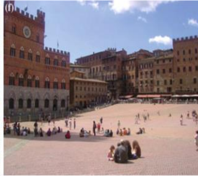
نموذج للمجال الحر في القرون الوسطى - بإيطاليا - Piazza del Campo