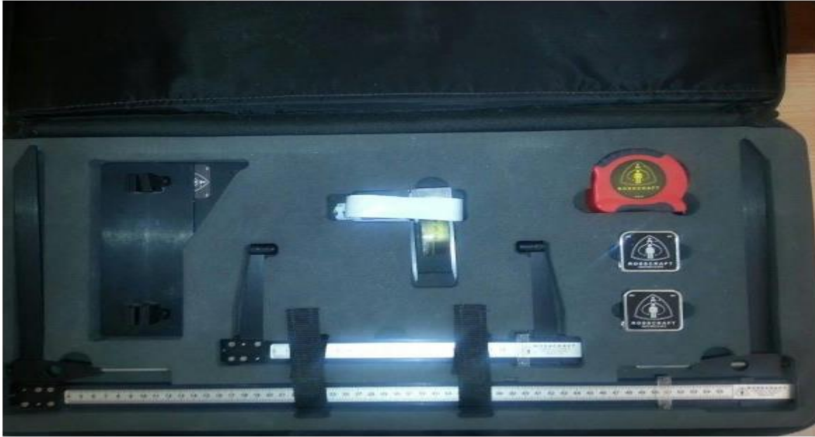
تبيين مكونات الحقيبة الأنثروبومترية من نوع coffret anthropométrique de harpenden