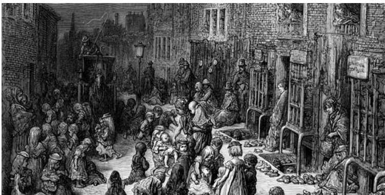
Un quartier ouvrier en Grande-Bretagne

Avec l'arrivée massive et rapide des populations rurales (paysans et travailleurs agricoles) dans les villes, on arrive mal à développer les infrastructures (routes, logements, aqueducs, etc.) nécessaires pour les accueillir. De façon générale, cette population pauvre se retrouve dans des quartiers entassés et dans des logements insalubres (qui nuit à la santé). De plus, les quartiers ouvriers se situent près des usines dans un environnement pollué par les émanations de charbon et les déversements de produits toxiques dans les eaux.