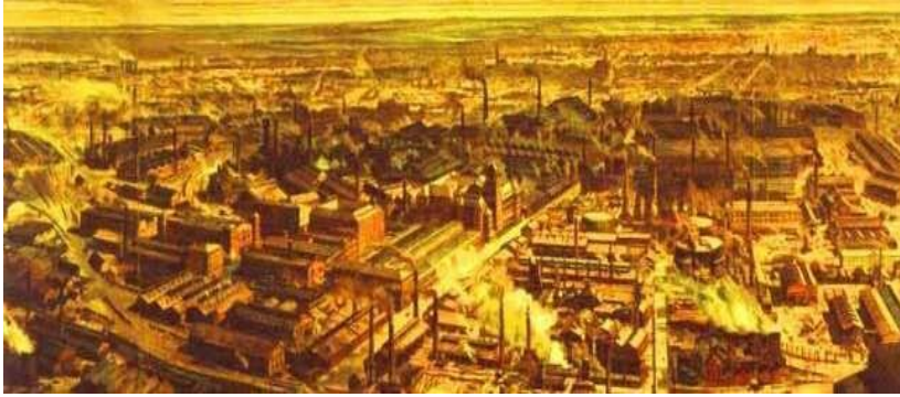
Une ville industrielle britannique typique

Les changements en agriculture ont forcé les paysans pauvres à quitter la campagne pour se trouver du travail en ville. Cet exode rural favorise la disponibilité de la main-d'œuvre au début de l'industrialisation britannique. Plus tard, lorsque le processus d'industrialisation est bien enclenché, l'exode rural s'accélère. De plus en plus de paysans se dirigent vers les villes en espérant améliorer leurs conditions de vie et de travail. En bref, l'industrialisation a eu comme conséquence d'accélérer l'exode rural et l'urbanisation.