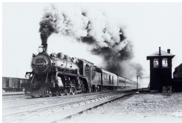
La locomotive à vapeur

Les méthodes de production se transforment par rapport à ce qui existait auparavant : l'artisanat. L'industrie qui apparaît en Angleterre à la fin du 18 e siècle utilise, par exemple dans le textile, non plus la force de l'homme ou celle de l'animal, mais désormais celle de la machine à vapeur. Le travail industriel ne se fait plus dans les ateliers en ville ou au domicile des ouvriers mais désormais les nouvelles machines sont regroupées dans des usines qui emploient beaucoup d'hommes.