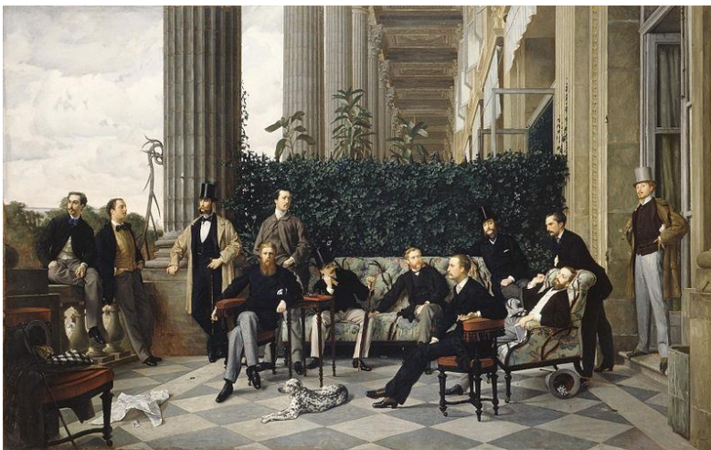
La bourgeoisie au 19e siècle

Lors du Moyen Âge, la bourgeoisie n'a cessé d'augmenter son influence dans la société, sur le plan économique pour commencer et plus tard sur le plan politique. Pendant la Renaissance et les grandes découvertes, les bourgeois britanniques ont accumulé des fortunes en commerçant avec les nouvelles colonies. De plus, certains d'entre eux réussissent progressivement à se faire élire en tant que députés parlementaires.