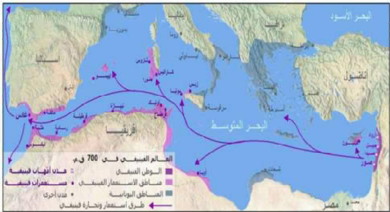
الشكل رقم 15: خريطة التوسع التجاري الفينيقي