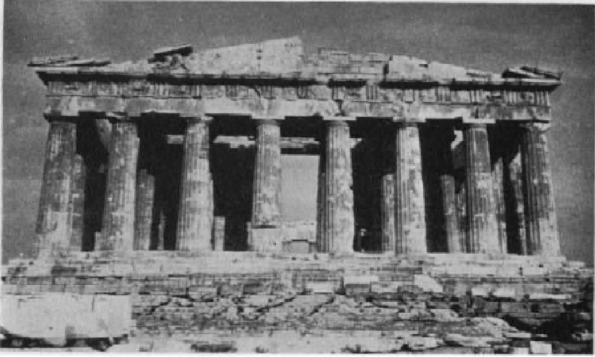
الشكل رقم 24: معبد البارثينون في أثينا

ومن الطقوس اليونانية القديمة تقديم الأضاحي إلى الآلهة سواء من جنس البشر أو من جنس الحيوانات أو من فصيلة النباتات والمحاصيل الزراعية كالحبوب والبقول والكروم وكان الكهنة يحصلون على جزء من القرابين، أما نظرة الاغريق إلى الحياة الآخرة فقد كانت قائمة مخزنة وبعيدة عن المنطق. 1