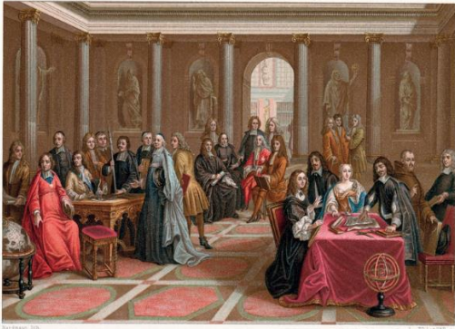
Pierre-Louis Dumesnil, Christine de Suède écoutant une démonstration de René Descartes , 1700, huile sur toile, 97 x 126 cm, musée national, Versailles.

► La science au service du pouvoir. Les progrès des connaissances techniques et scientifiques servent également à exalter la figure royale et à attirer les talents les plus renommés de l'Europe scientifique. En 1666, Louis XIV accorde par exemple à l'astronome hollandais Christian Huygens une gratification annuelle de 6 000 livres ainsi qu'un logement. La reine Christine de Suède fait de sa cour un lieu majeur de l'Europe des sciences, y invitant des savants prestigieux, comme le Français René Descartes .