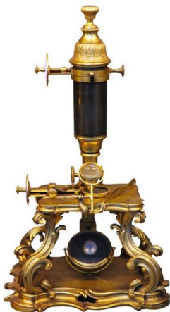
Microscope optique, XVIII e siècle.

Né en 1596, René Descartes est un mathématicien, physicien et philosophe français. Il publie en 1637 le Discours de la méthode pour bien conduire sa raison et chercher la vérité dans les sciences , premier ouvrage de philosophie rédigé en français et non en latin. Il contribue grandement aux progrès de l'optique et adopte les thèses de Copernic et de Galilée sur le système solaire.