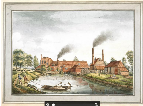
Des paysages transformés. (L'Industrialisation)

► La marche vers l'industrialisation. La machine à vapeur et la navette volante permettent l'apparition d'une première mécanisation du travail. En Angleterre, ces innovations se traduisent par une forte croissance économique, en particulier dans le secteur textile. La demande intérieure de produits manufacturés augmente de 42 % entre 1750 et 1800. Cette première industrialisation a également un impact important sur les paysages avec l'apparition des premières usines ( doc. 3 ).