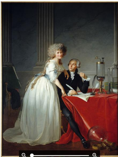
La science au masculin et au féminin : les Lavoisier, chimistes du XVIII e siècle

Jacques-Louis David, Portrait d'Antoine-Laurent et Marie-Anne Lavoisier , 1788, huile sur toile (détail), 259 x 195 cm, Metropolitan Museum of Art, New York.