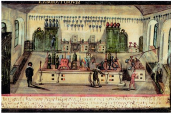
Un laboratoire au XVII e siècle