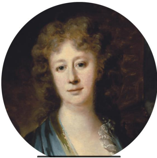
Eva Ekeblad (1724-1786)

► Le siècle de l'agronomie. Les agronomes 11 multiplient les réflexions pour améliorer l'agriculture. L'Anglais Jethro Tull invente le semoir mécanique au début du XVIII e siècle ( doc. 1 ) ; la première Société d'agriculture française est établie à Rennes en 1757. On cherche à stimuler les cultures utiles et rémunératrices comme le colza, le chanvre, le lin, le houblon, le tabac, le navet ou la pomme de terre. Cette dernière est introduite en Suède dès 1658, et se répand massivement grâce à Eva Ekeblad .