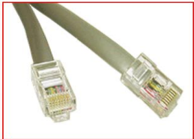
Câble à paires torsadées.