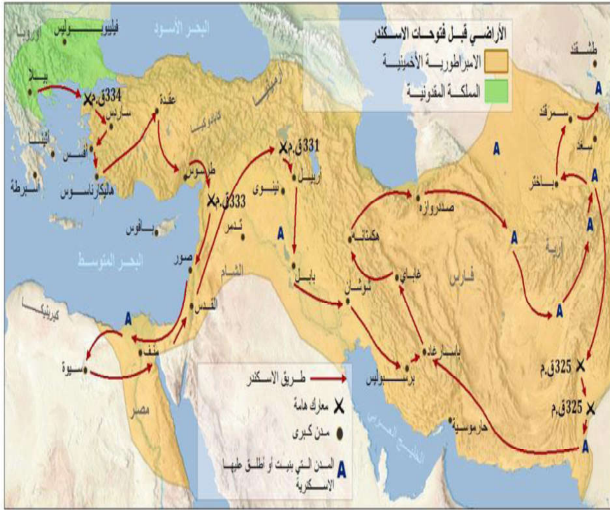
الشكل رقم 25: خريطة توسعات الاسكندر المقدوني

وما إن حلت سنة 270 ق.م حتى تقاسم خلفاؤه الإمبراطورية ما بين السلوقيين الذين حكموا أجزاء كبيرة من الإمبراطورية الفارسية بآسيا والبطالمة الذين حكموا مصر وترجع آل أنتيجونيس على عرش مقدونية وظهرت مملكة برجامة في آسيا الصغرى، كما أن روما بدأت تظهر كقوة جديدة على مسرح الأحداث. 1