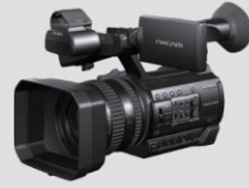
حمل الكاميرا باليد