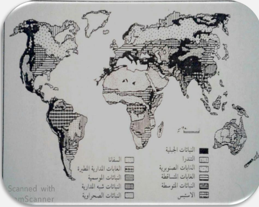
الشكل 3. المناطق البيئية الحوية في العالم

بنا: على ما تقدم فقد تمكن الباحث من وضع مناطق البيئات الحوية (النباتية والحيوانية) في العالم إلى مجموعات ركل مجموعة تضم عدة مناطق بيئية: (شكل 3).