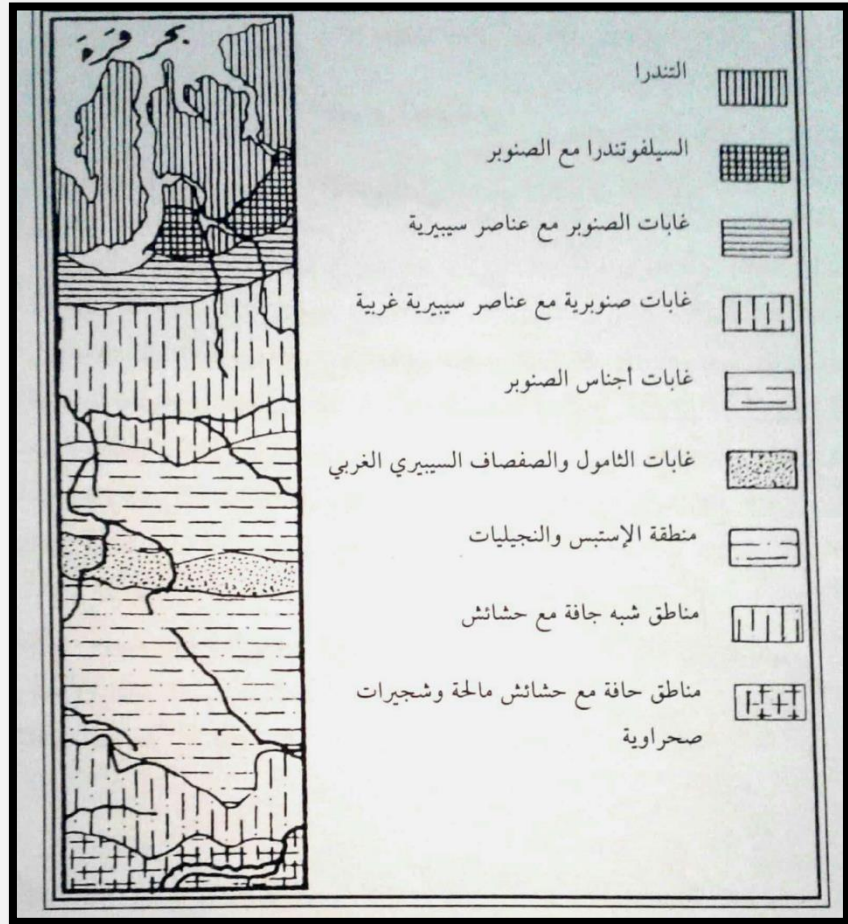
الشكل 1. التوزيع الأفقي للنباتات حسب خطوط العرض

إن الأسباب الرئيسية للتوزيع النباتي حسب خطوط العرض هي شكل الأرض وموقعها في مواجهة الشمس، هذا ما يؤدي إلى تقسيم الإشعاع الشمسي بشكل تدريجي إلى مناطق. وأيضا يكون الغطاء الجغرافي بما فيه عالم النبات وعالم الحيوان موزعة على شكل مناطق أفقية، ومثال على ذلك: اختلاف مناطق النباتات حسب خطوط العرض في السهل السيبيري الغربي بين بحر قره وخليج الأوب. وهناك مثال آخر على التوزيع الأفقي في أمريكا الشمالية، حيث تتوزع النباتات أفقية إلى ثلاث مناطق، هي منطقة نباتات البحر المتوسط ومنطقة نباتات الغابات الصنوبرية ومنطقة حشائش البراري ومنطقة الغابات النفضية. (شكل 1)