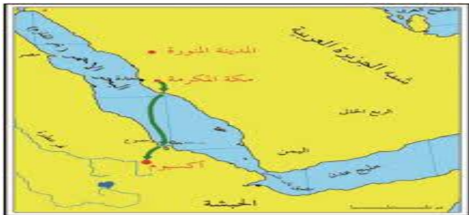
خريطة توضح طريق الهجرة إلى الحبشة