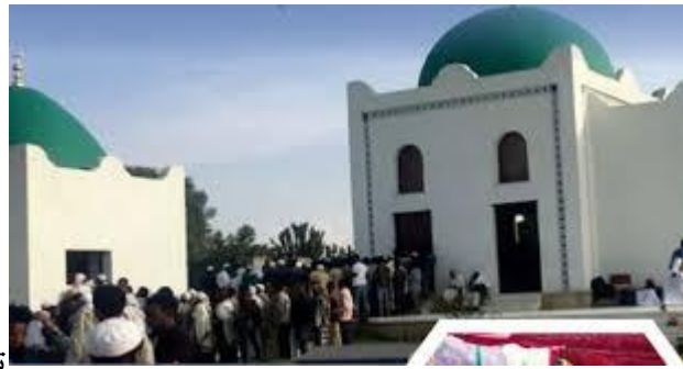
تيجراي المسجد الأول في قرية النجاشي