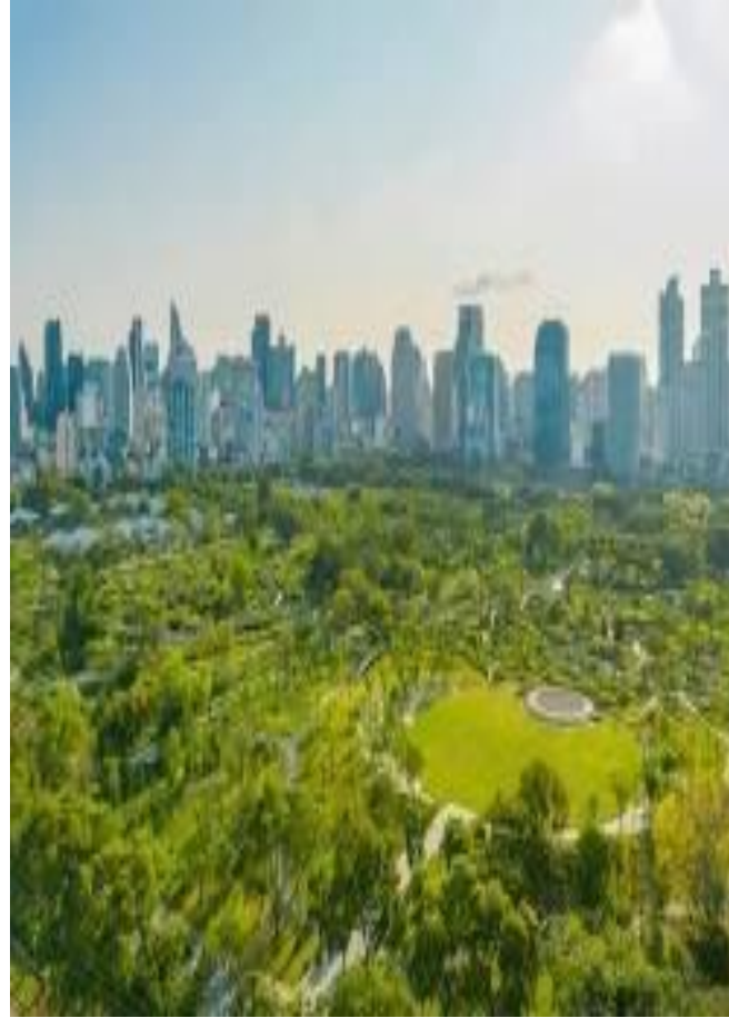
حديقة ذات حجم كبير