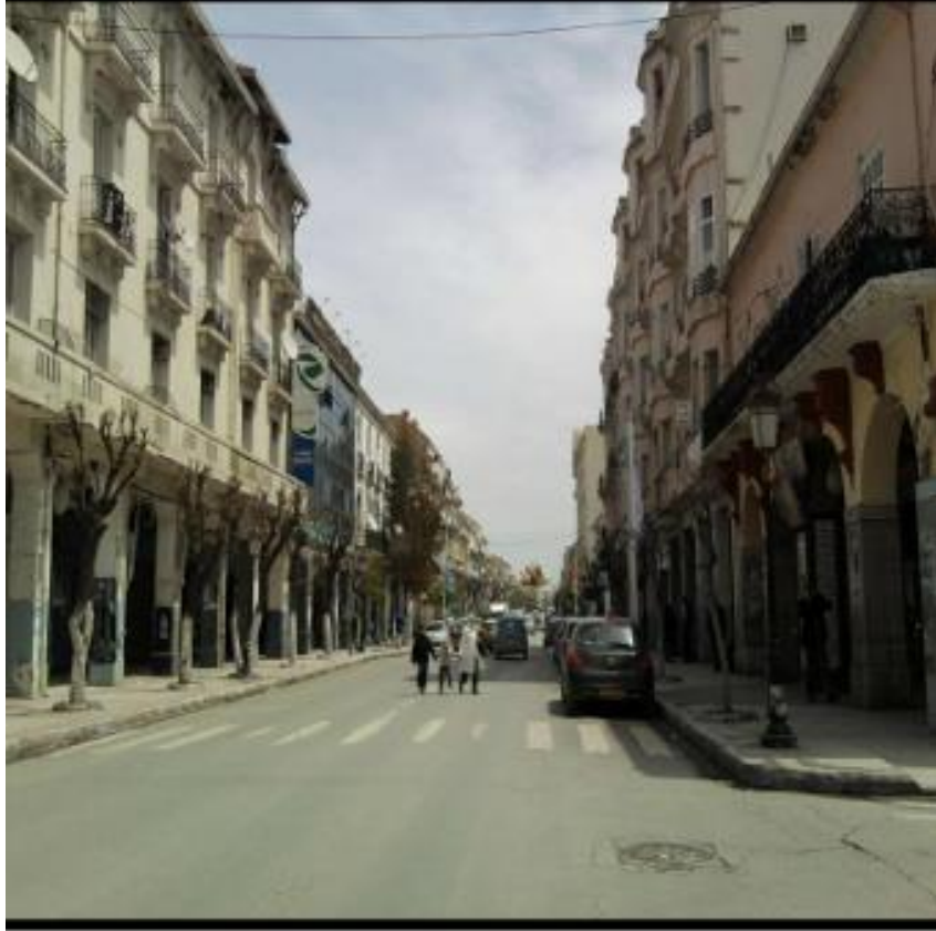
شارع 08 ماي 1945 بمدينة سطيف