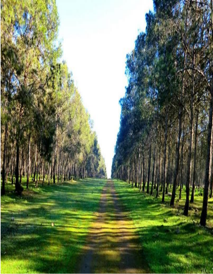
مساحة خضراء مفتوحة