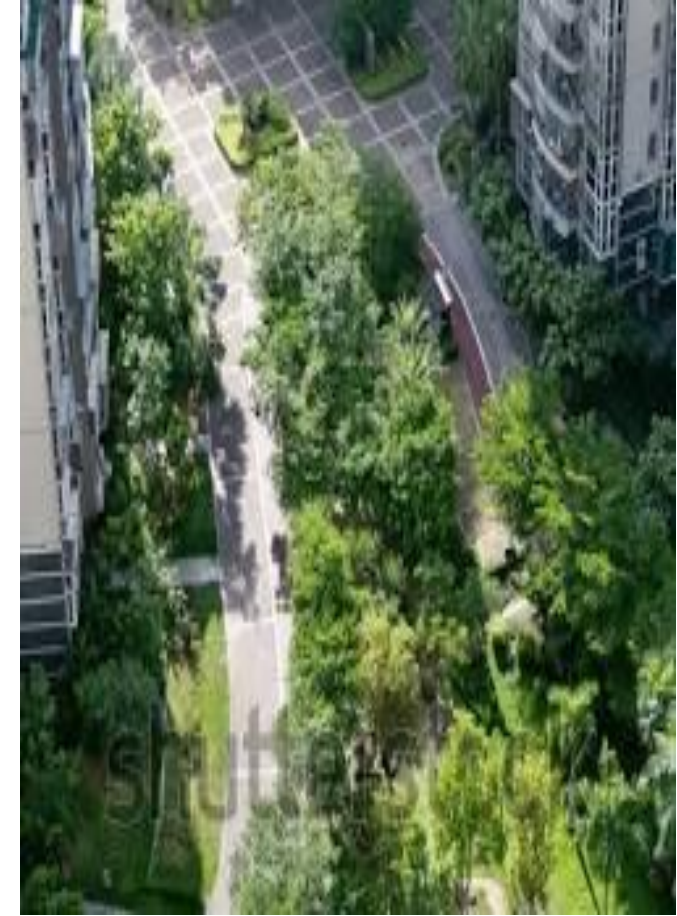
مساحة خضراء داخل الحي